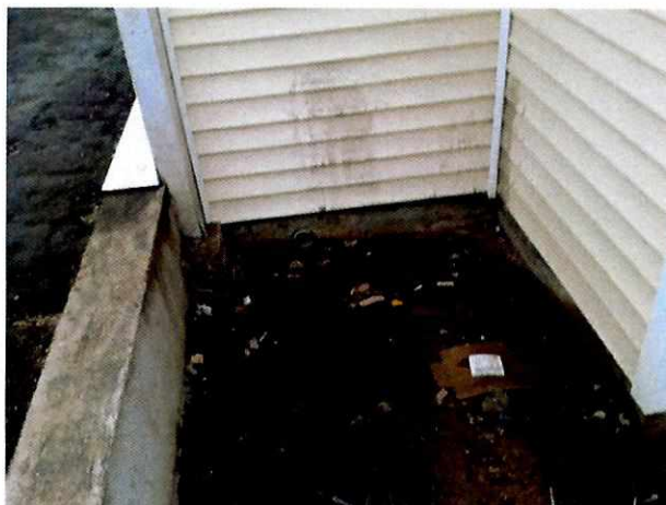
Fotografía N° 8.

3) Acumulación de agua debido a la inexistencia de un sistema de drenaje de aguas lluvias.