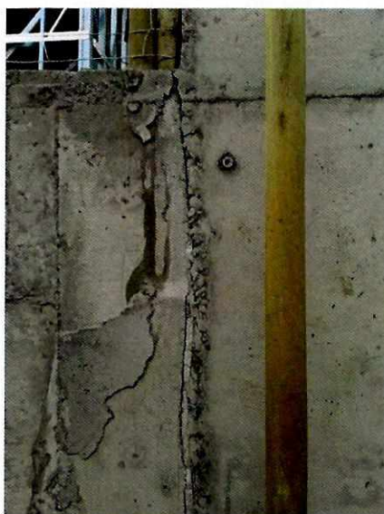
Fotografía N° 6