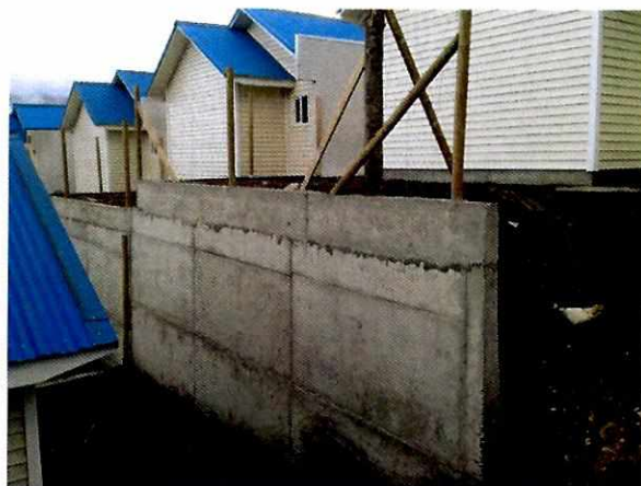
Fotografía N° 5

2) Deficiencias en el modo de ejecución de las uniones de hormigones de distintas edades y mala programación de las faenas de hormigonado.