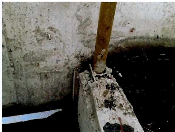
Fotografía N° 2