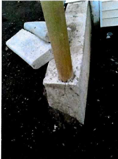
Fotografía N° 1

1) Presencia de nidos de piedra, fracturas, fisuras, aristas rotas, armaduras a la vista y pérdida de material en algunos de los muros de hormigón exteriores del área de acceso a las viviendas y en muros de contención de terrazas.