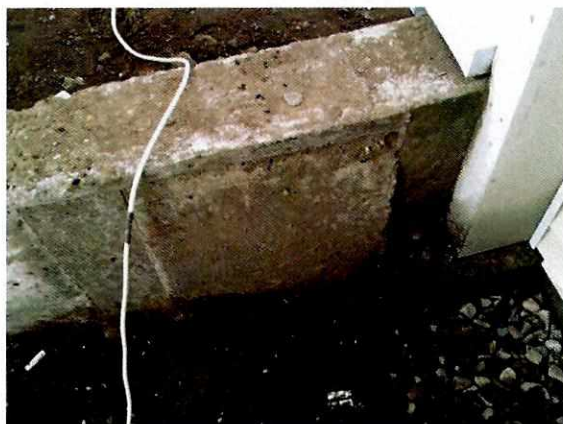
Fotografía N° 3