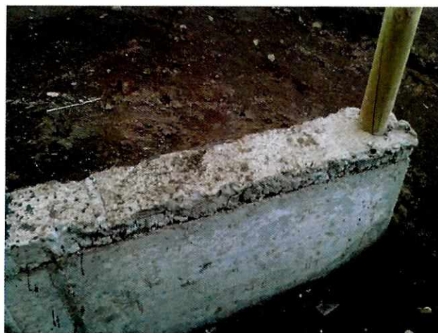
Fotografía N° 7.

3) Acumulación de agua debido a la inexistencia de un sistema de drenaje de aguas lluvias.